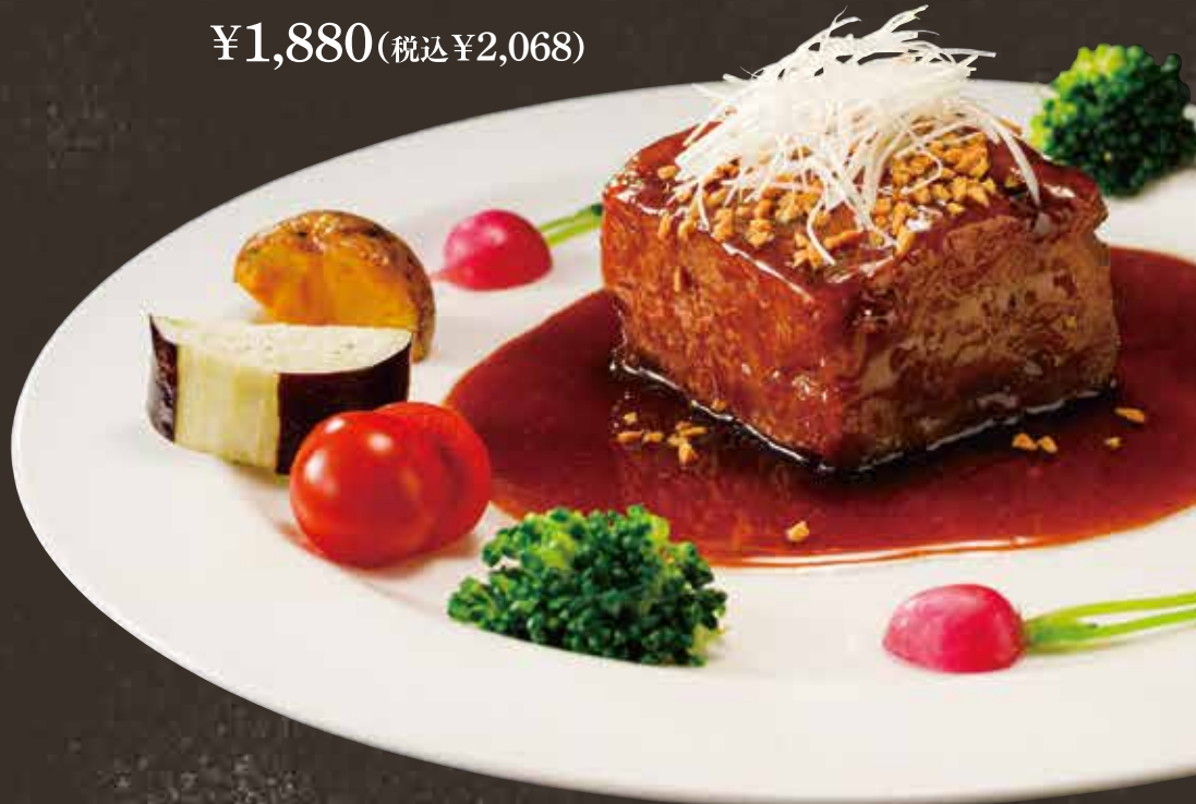
ゲンコツ酢豚 ¥1,880(税込¥2,068)