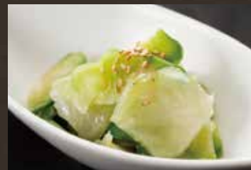
生ザーサイの浅漬け ¥420(税込¥462)