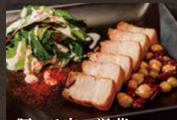
豚バラ肉の温菜 五香紛仕立て ¥1,050(税込¥1,155)