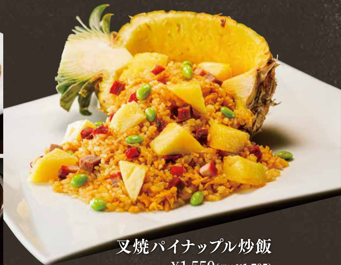
叉焼パイナップル炒飯