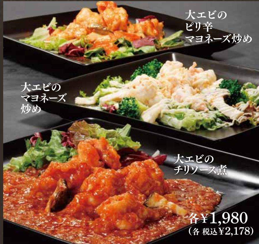
大エビの ピリ辛 マヨネーズ炒め