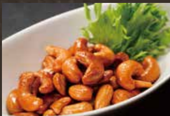
フライドカシューナッツ ¥330(税込¥363)