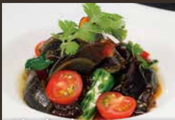
ピータンと 木耳の和え物 ¥650(税込¥715)