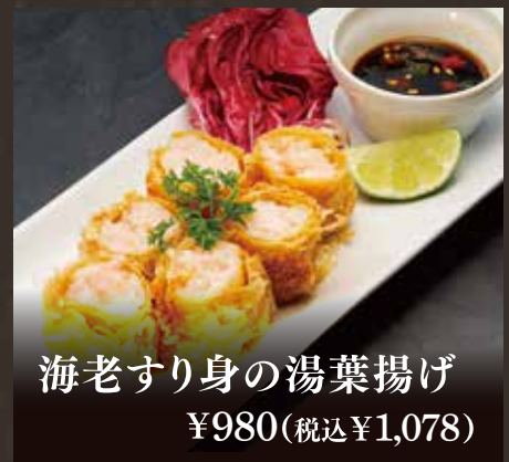
海老すり身の湯葉揚げ ¥980(税込¥1,078)