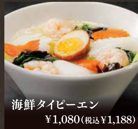
海鮮タイピーエン ¥1,080(税込¥1,188)