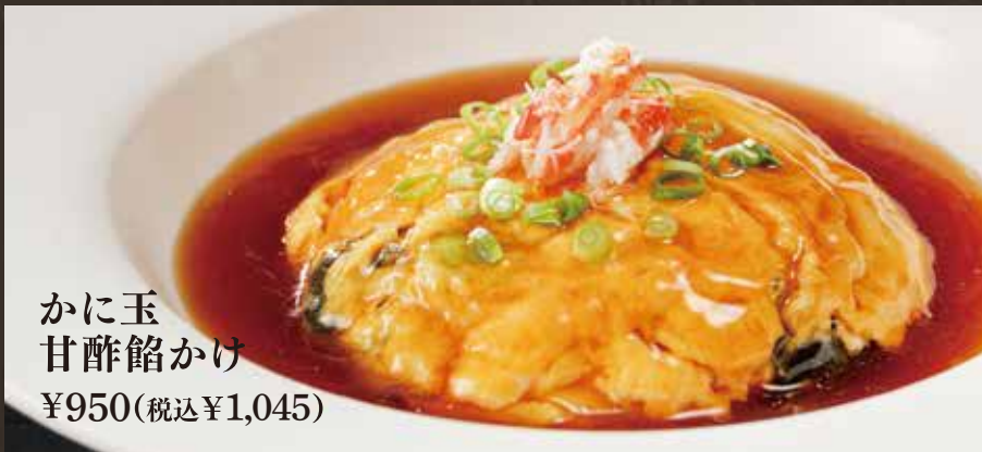
かに玉 甘酢餡かけ ¥950(税込¥1,045)