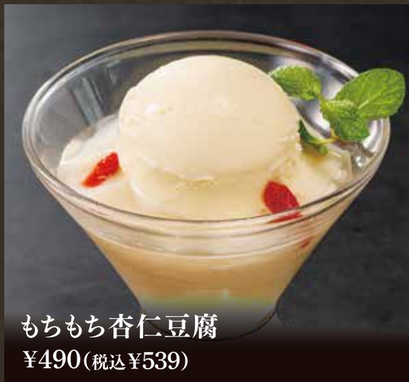
もちもち杏仁豆腐 ¥490(税込¥539)