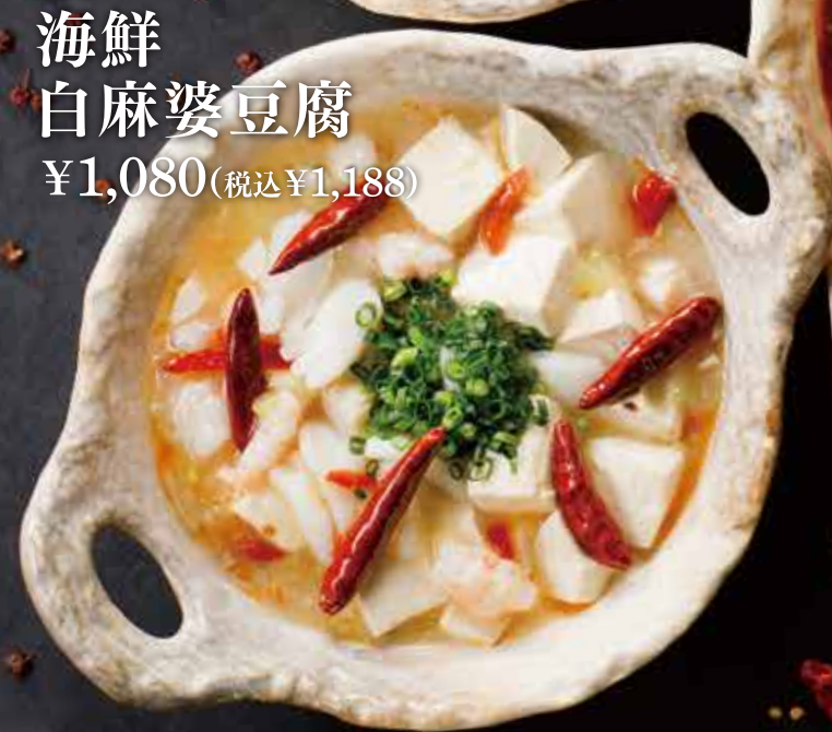
海鮮 白麻婆豆腐 ¥1,080(税込¥1,188)