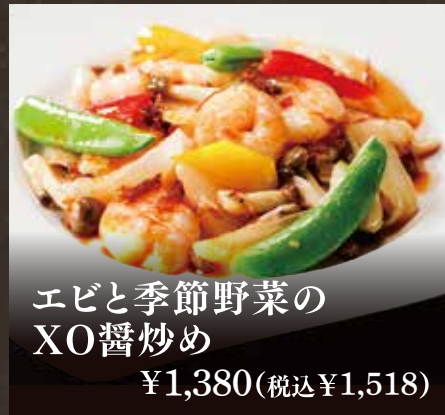
エビと季節野菜の XO醬炒め ¥1,380(税込¥1,518)