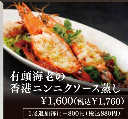
有頭海老の 香港ニンニクソース蒸し ¥1,600(税込¥1,760)