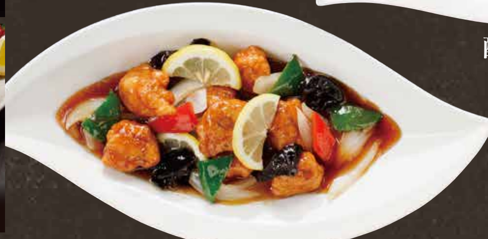
レモン酢豚 (レモン醤油)