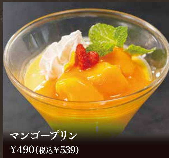
マンゴープリン ¥490(税込¥539)