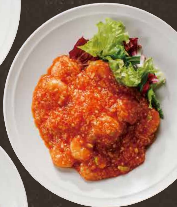
エビの チリソース煮