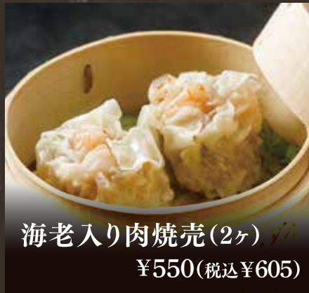
海老入り肉焼売(2ヶ) ¥550(税込¥605)