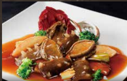
アワビ・ナマコの上海煮 ¥4,280(税込¥4,708)