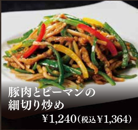
豚肉とピーマンの 細切り炒め ¥1,240(税込¥1,364)