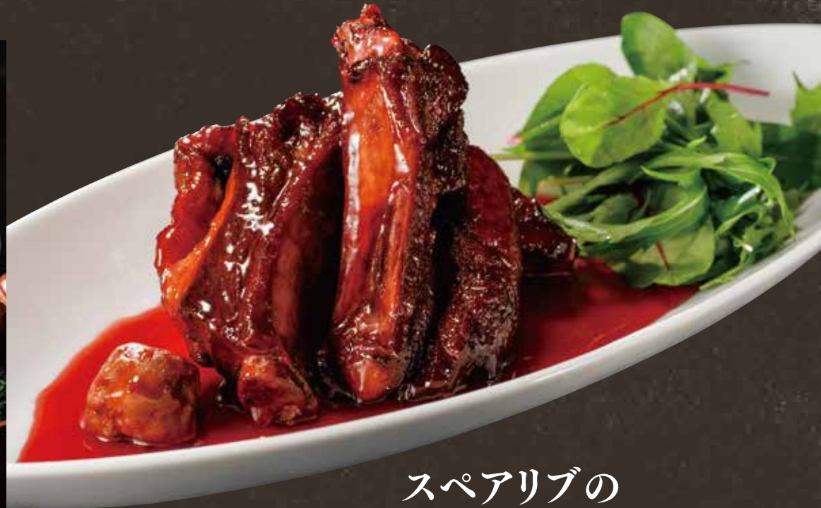
スペアリブの 梅酢仕立て ¥1,420(税込¥1,562)