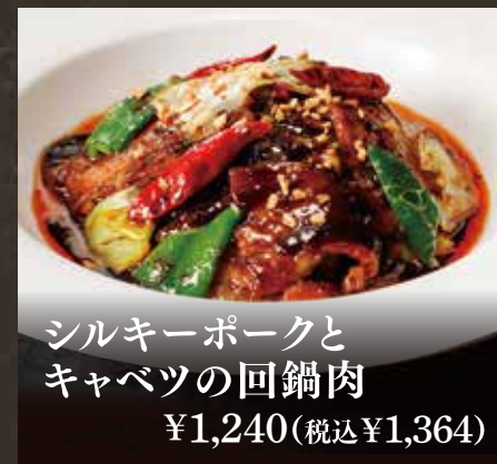
シルキーポークと キャベツの回鍋肉 ¥1,240(税込¥1,364)