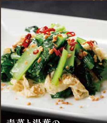
青菜と湯葉の ニンニク塩炒め ¥890(税込¥979)