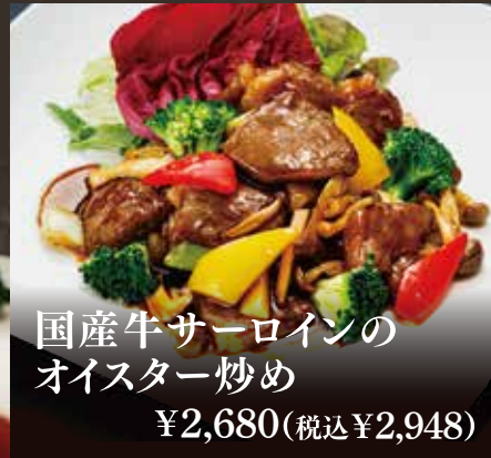
国産牛サーロインの オイスター炒め ¥2,680(税込¥2,948)