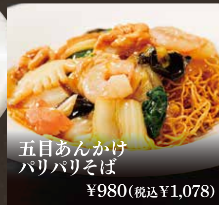
五目あんかけ パリパリそば ¥980(税込¥1,078)