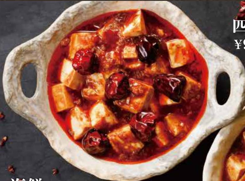
四川麻婆豆腐 ¥980(税込¥1,078)