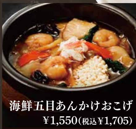
海鮮五目あんかけおこげ