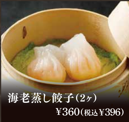
海老蒸し餃子(2ヶ) ¥360(税込¥396)