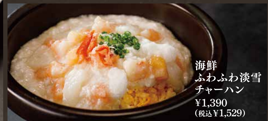
海鮮 ふわふわ淡雪 チャーハン