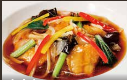
白身魚の 野菜甘酢あんかけ ¥1,150(税込¥1,265)