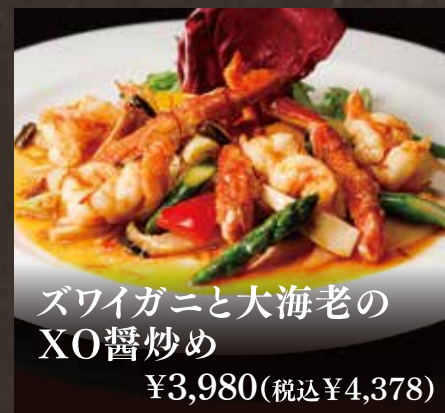
ズワイガニと大海老の XO醬炒め ¥3,980(税込¥4,378)