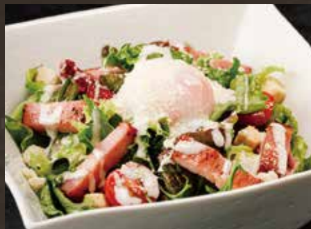
ベーコンと温玉の 黒酢サラダ ¥980(税込¥1,078)