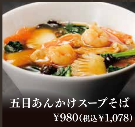
五目あんかけスープそば ¥980(税込¥1,078)