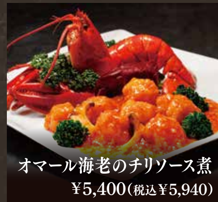
オマール海老のチリソース煮 ¥5,400(税込¥5,940)