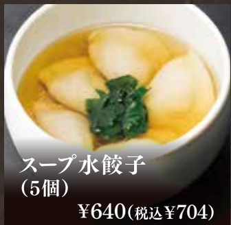
スープ水餃子 (5個) ¥640(税込¥704)