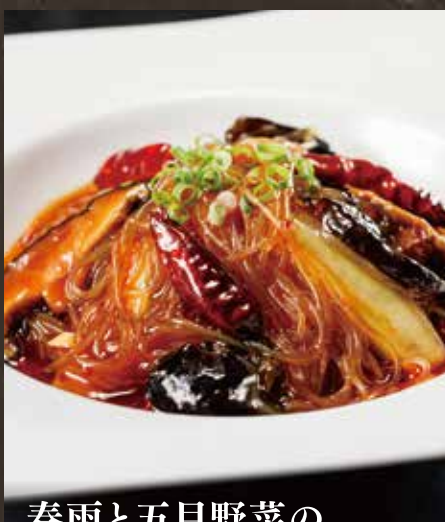
春雨と五目野菜の ピリ辛炒め煮 ¥920(税込¥1,012)