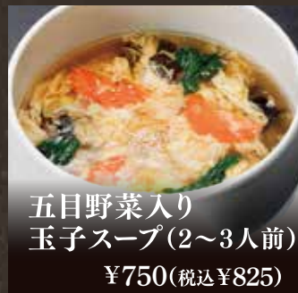
五目野菜入り 玉子スープ(2~3人前) ¥750(税込¥825)