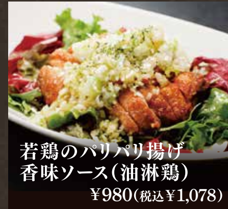
若鶏のパリパリ揚げ 香味ソース(油淋鶏) ¥980(税込¥1,078)