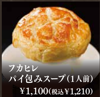
フカヒレ パイ包みスープ(1人前) ¥1,100(税込¥1,210)