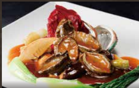
アワビの上海煮 ¥4,480(税込¥4,928)