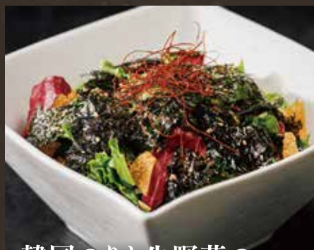
韓国のりと生野菜の ゴマオイルサラダ ¥830(税込¥913)