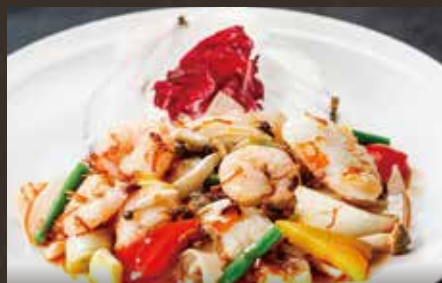
海鮮三種XO醬炒め ¥1,580(税込¥1,738)