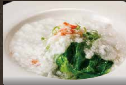
季節野菜の蟹肉餡かけ ¥990(税込¥1,089)