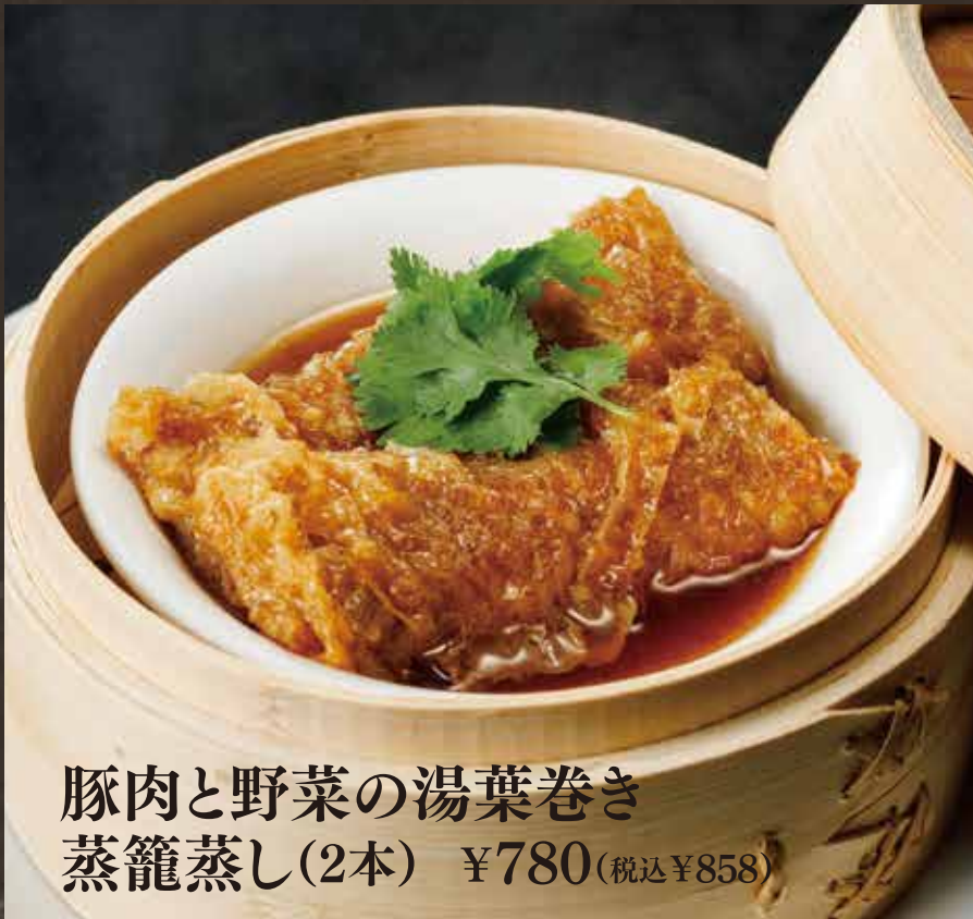
豚肉と野菜の湯葉巻き 蒸籠蒸し(2本) ¥780(税込¥858)