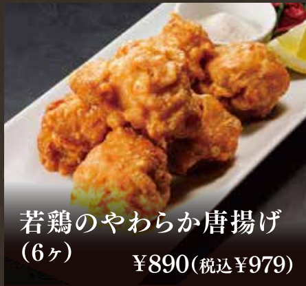
若鶏のやわらか唐揚げ (6ヶ) ¥890(税込¥979)