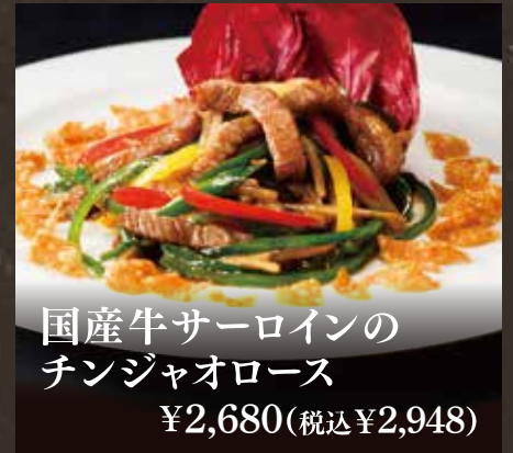
国産牛サーロインの チンジャオロース ¥2,680(税込¥2,948)