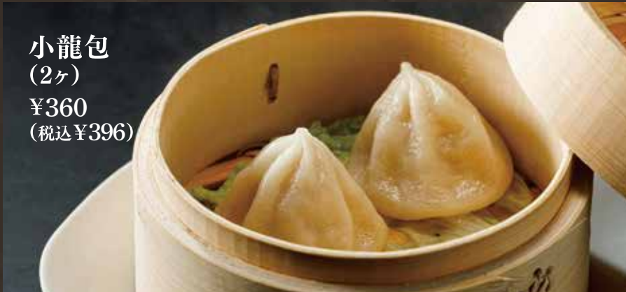
小龍包 (2ヶ) ¥360 (税込¥396)