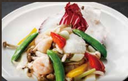
海鮮三種と 季節野菜の塩炒め ¥1,580(税込¥1,738)