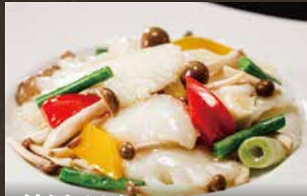
紋甲イカと 季節野菜の塩炒め ¥1,250(税込¥1,375)