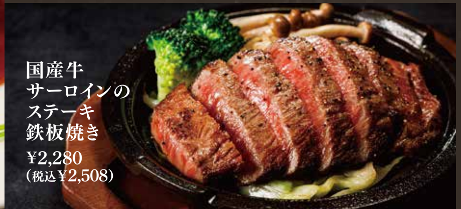
国産牛 サーロインの ステーキ 鉄板焼き ¥2,280 (税込¥2,508)