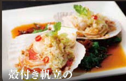
殻付き帆立の 香港ニンニクソース蒸し ¥1,480(税込¥1,628) 1枚追加毎に+740円(税込814円)