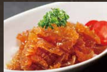
中華クラゲ頭の冷菜 ¥680(税込¥748)