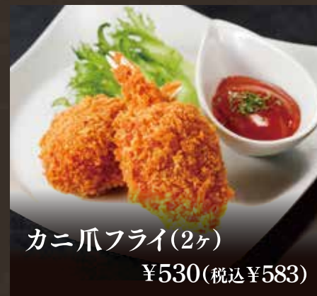
カニ爪フライ(2ヶ) ¥530(税込¥583)