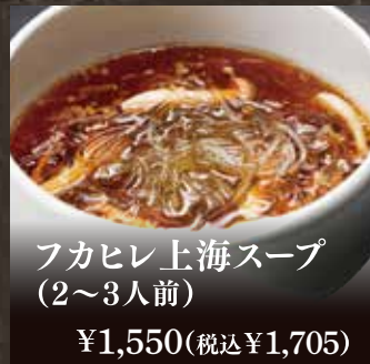
フカヒレ上海スープ (2~3人前) ¥1,550(税込¥1,705)