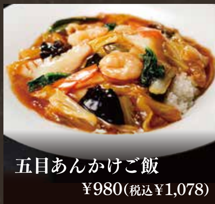
五目あんかけご飯