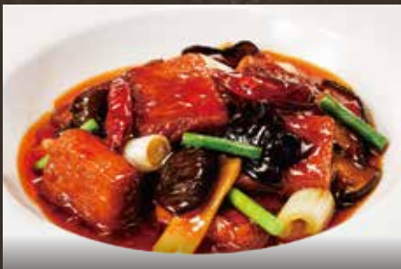
揚げ豆腐の辛子煮込み ¥940(税込¥1,034)