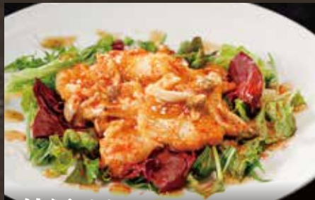
紋甲イカの ピリ辛マヨネーズ炒め ¥1,250(税込¥1,375)