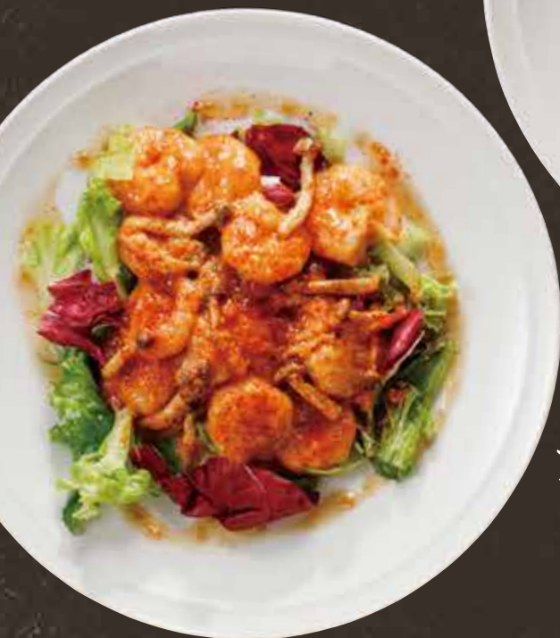
エビの ピリ辛マヨネーズ炒め