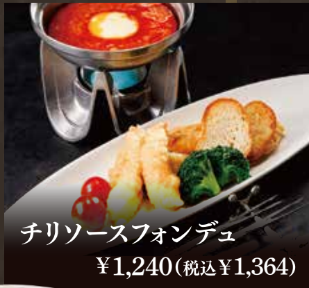
チリソースフォンデュ ¥1,240(税込¥1,364)