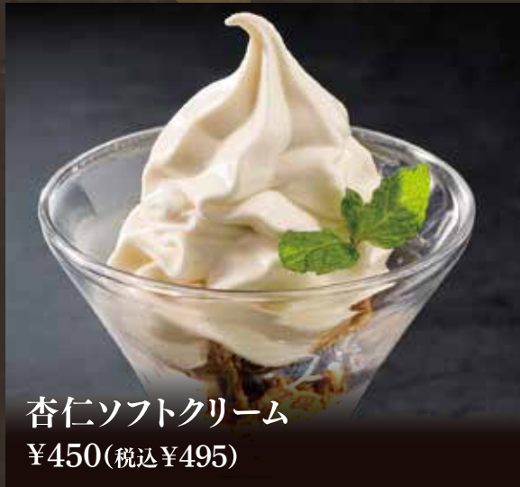
杏仁ソフトクリーム ¥450(税込¥495)