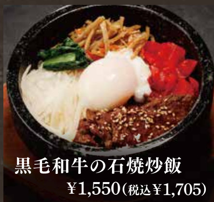
黒毛和牛の石焼炒飯