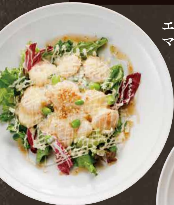
エビの マヨネーズ炒め