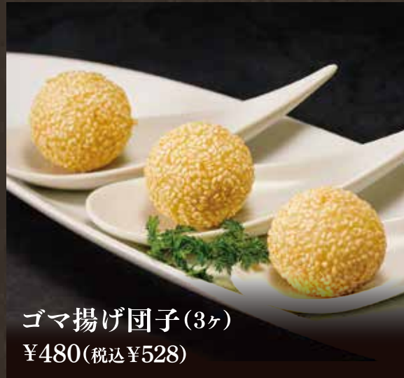
ゴマ揚げ団子(3ヶ) ¥480(税込¥528)