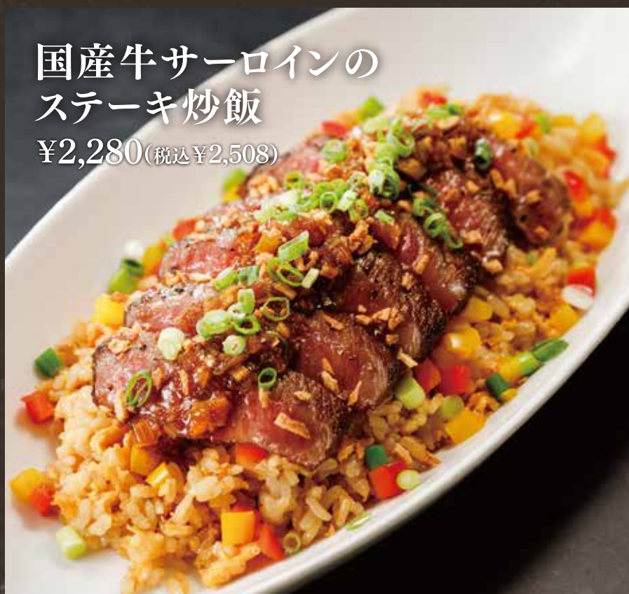
国産牛サーロインの ステーキ炒飯