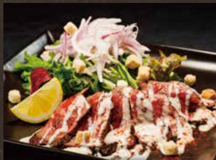
和牛タタキの シーザーサラダ ¥1,420(税込¥1,562)