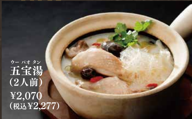
ウーパオタン 五宝湯 (2人前) ¥2,070 (税込¥2,277)