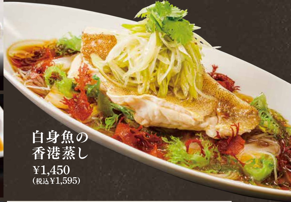
白身魚の 香港蒸し ¥1,450 (税込¥1,595)