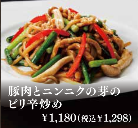
豚肉とニンニクの芽の ピリ辛炒め ¥1,180(税込¥1,298)