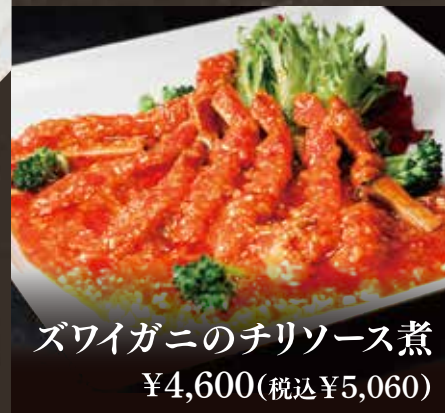
ズワイガニのチリソース煮 ¥4,600(税込¥5,060)