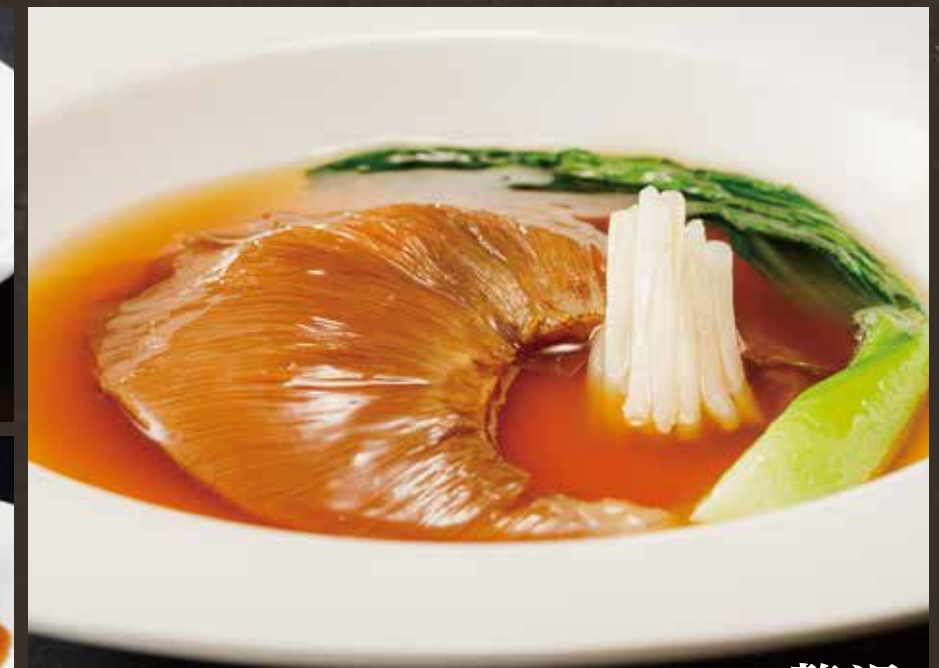
贅沢 フカヒレ姿煮 ¥6,500(税込¥7,150)