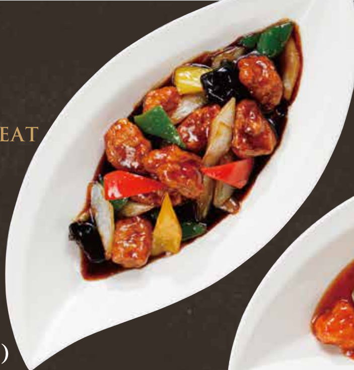
黒酢 酢豚 (黒酢)