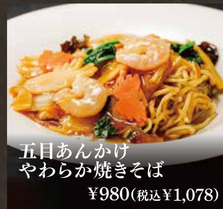
五目あんかけ やわらか焼きそば ¥980(税込¥1,078)