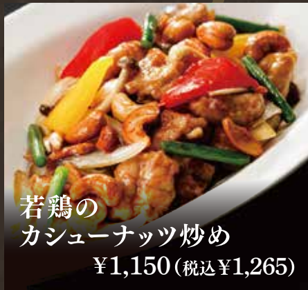
若鶏の カシューナッツ炒め ¥1,150(税込¥1,265)