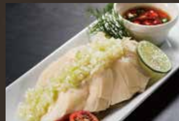
蒸し鶏の葱ソースかけ ¥880(税込¥968)