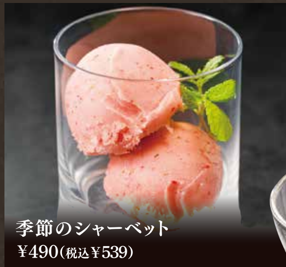
季節のシャーベット ¥490(税込¥539)